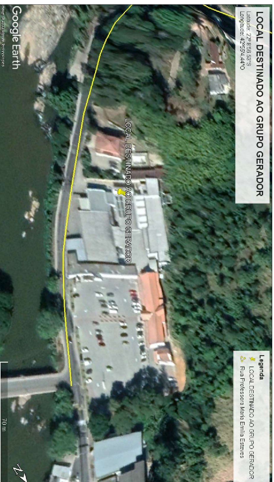
1 Planta de localização esc 1/1250